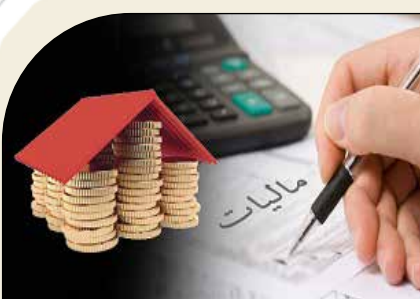
برآی طرح های عمراتی استان فارس؛